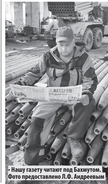
Нашу газету читают под Бахмутом.